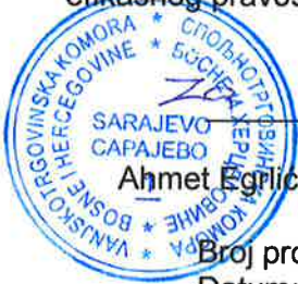
Ahmet Egrić, predsjednik VTK/STK BiH

Ova aktivnost se realizuje uz finansijsku podršku Evropske Unije kroz Projekat „Izgradnja efikasnog pravosuđa u službi građana – IPA 2017“